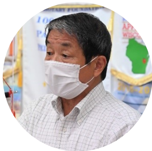
2021-22年度決算報告 前年度会計：中川 筆之会員