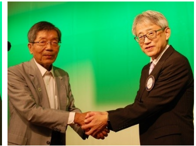
【会長エレクト章継承】