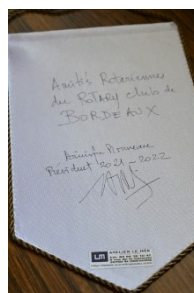
「ボルドーRCからの友好」